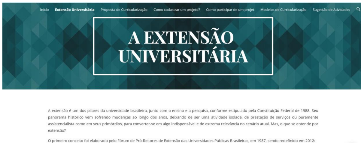
Figura 2 – Subseção “A Extensão Universitária” do tutorial na página de internet.