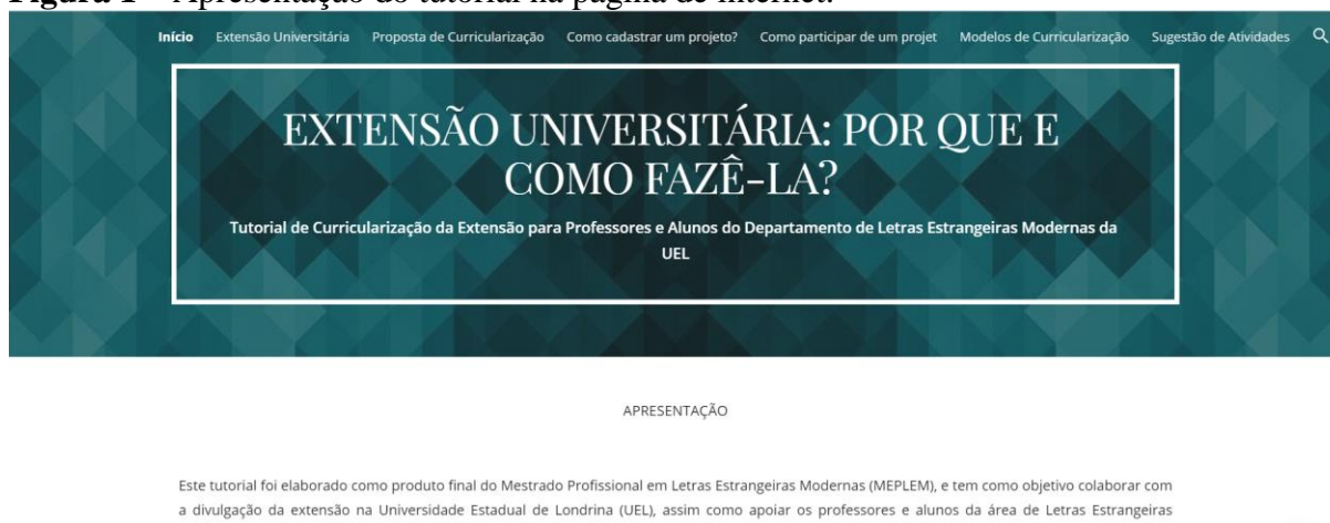
Figura 1 – Apresentação do tutorial na página de internet.

Na sequência estão algumas imagens demonstrativas de como o tutorial foi organizado no website .