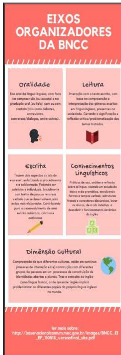
Figura 05 - Infográfico produzido por uma das participantes