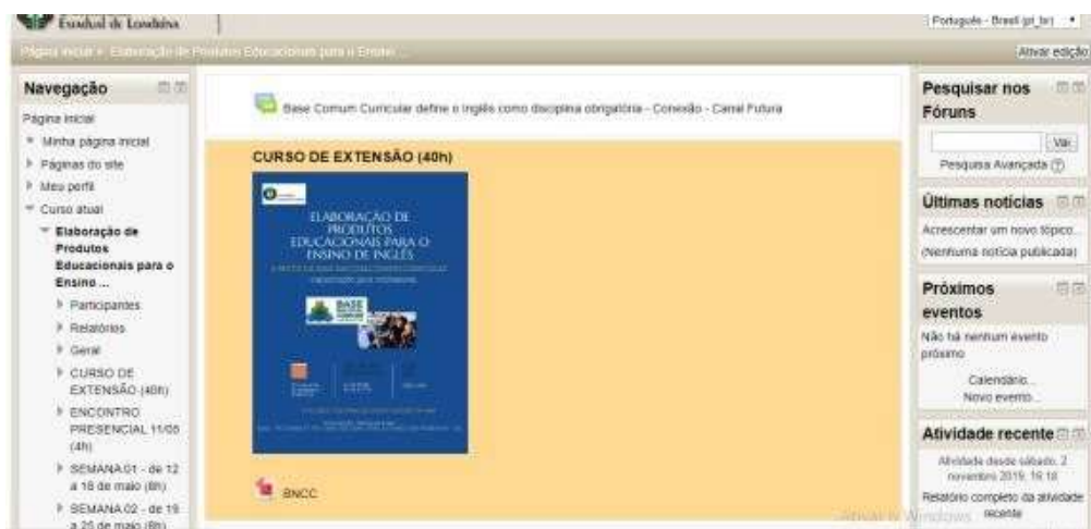
Figura 02 – Página Inicial do curso

indicou-se uma temática a ser explorada por cada um deles (Língua Franca, Multiletramentos e os Eixo leitura, oralidade, escrita, dimensão intercultural e conhecimentos linguísticos). Durante a interação presencial, os participantes desenvolveram cartazes sobre as temáticas e apresentaram oralmente suas percepções. O encontro presencial foi finalizado apresentando o curso na plataforma Moodle . Na página inicial do Moodle foi inserido um vídeo explicativo sobre base comum curricular 7 , além do cartaz de divulgação e também o documento completo da BNCC em de planilhas para consulta.