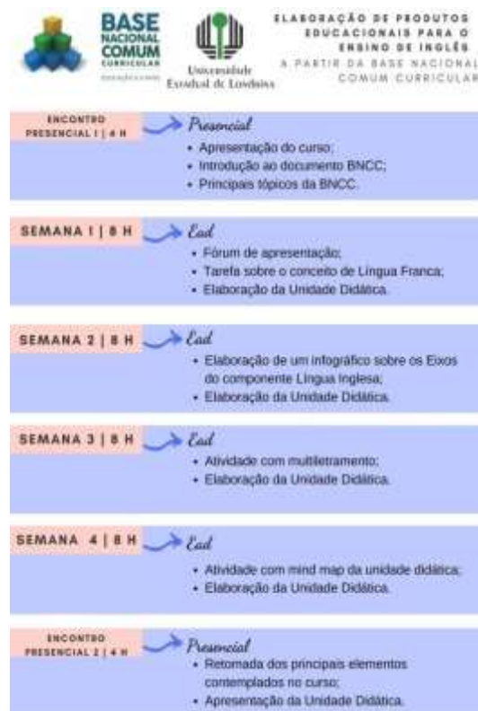
Figura 01 - Atividades propostas no curso de extensão.

O curso foi realizado nos meses de maio e junho de 2019 e dividido em seis partes, sendo dois encontros presenciais de oito horas (8h) e as atividades desenvolvidas em EAD, durante quatro semanas com trinta e duas horas (32h). A organização sequencial apresenta-se resumida na ilustração a seguir, lembrando que as atividades propostas semanalmente.